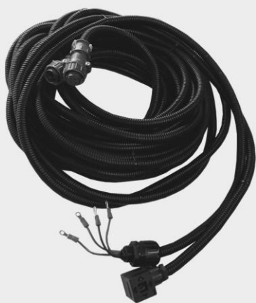
Соединение для блока управления